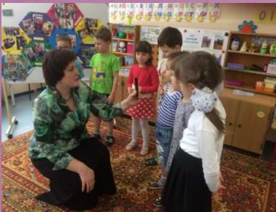
Корреспондент центрального телевидения